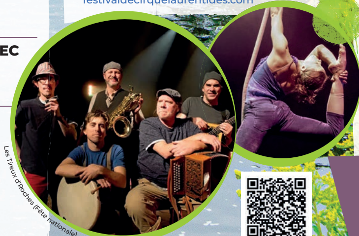
Les Titus d'Arches (Fête nationale)